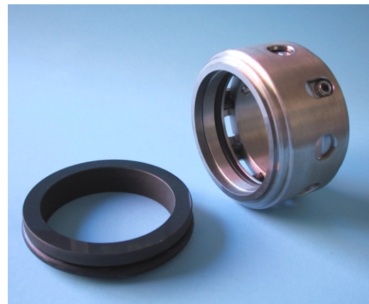
B92-R → cierre con rosca de bombeo

Cierre mecánico sencillo, equilibrado, de uso general, independiente del sentido de giro, multimuelle. Intercambiable con otras marcas.