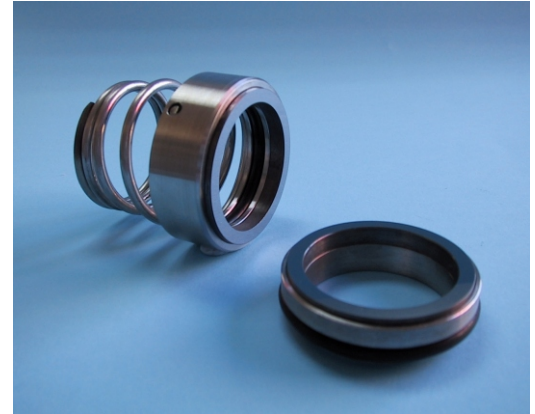
Tabla dimensiones - Medidas en mm N43 (EN 12756)

Cierre mecánico sencillo, no equilibrado, de uso general, dependiente del sentido de giro, muelle cónico.